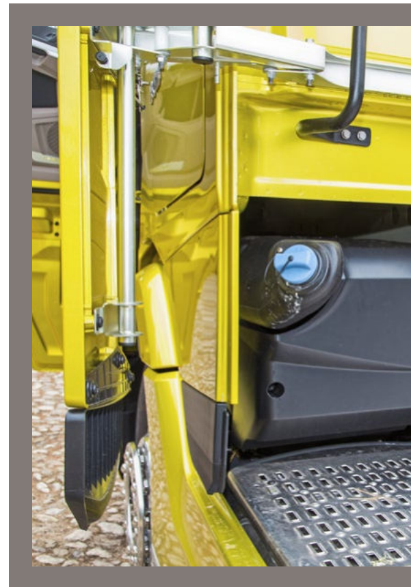
Der Sideflap hat nach vorn zu weichen, um den Weg zum Adblue-Tank freizumachen.

Selbst bei der Breite haben aber alle drei Fahrerhäuser noch einen Tick zugelegt und bringen es nun im Maximum auf 2.500 Millimeter zwischen den Flanken. Das ist ein Zentimeterchen mehr als beim bisherigen XF, der es da bei 2.490 Millimeter belässt. Die Stehhöhe innen drin staffelt sich ungefähr so: Über dem 170 Millimeter hohen Motortunnel sind beim neuen XF gut 1.800 Millimeter geboten, XG und XG+ kommen an dieser Stelle auf knapp 2.000 respektive gut 2.100 Millimeter. Das Bett erreicht bei XG und XG+ eine Breite von durchgängig 780 Millimetern. Beim neuen XF bleibt es bei den Einzügen jeweils hinter dem Sitz, und die Breite beläuft sich auf etwa 640 Millimeter hinter den Sitzen und rund 740 Millimeter im Mittelteil.