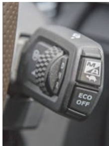
Die Automatikfunktionen sind nun größtenteils im neuen Lenkstockhebel versammelt.

So kommt es, dass einen innen drin im riesigen Gehäuse der XG+ genannten Kabine schon eher eine Suite als nur ein Hochdachfahrerhaus begrüßt. Drei Dinge beeindruckten auf Anhieb: Riesige Scheiben fluten das Apartment zum einen nicht nur mit Licht, sondern verbessern mit ihrer tief hinabgezogenen Unterkante oben drein die Sicht nach außen bemerkenswert.